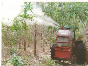
Controle de "percevejo bronzeado" em eucalipto