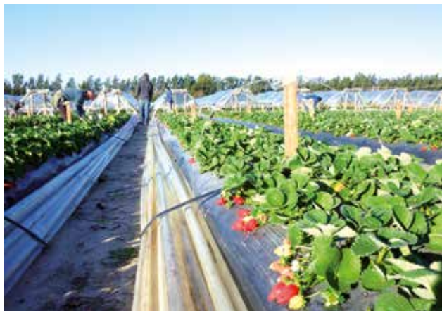
Figura 1 - La producción de frutilla de Salto abastece el mercado entre mediados de mayo y mediados de setiembre. Cosecha durante el invierno (23/7) en Granja Sant'Anna, Salto.

la aparición de las nuevas enfermedades que emergieron a partir de 2015 y las necesidades de avanzar en su conocimiento. También se analizaron las alternativas tecnológicas disponibles para enfrentar esta amenaza y se estimó el potencial de ser adoptadas por los productores.