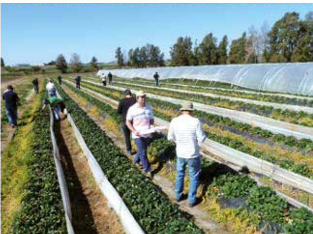
Figura 7 - Evaluación de clones en chacra por parte de integrantes del grupo de viveristas del norte y de INIA Salto Grande en 2018. En una ficha con atributos de interés previamente acordada cada integrante calificó individualmente a los nuevos clones avanzados y luego se compartieron opiniones en conjunto.

La población de mejoramiento genético disponible en INIA Salto Grande en 2017 fue seleccionada por su to-