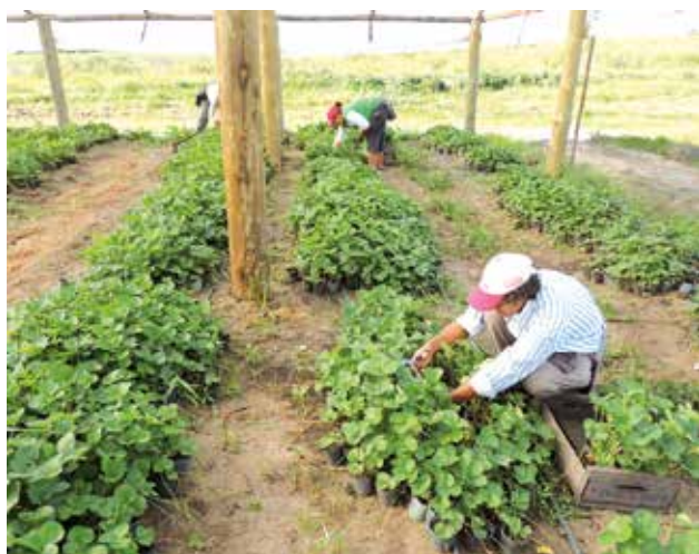
Figura 4 - En Salto cada productor se abastece de sus propias plantas. Los viveros se realizan en el mismo predio donde se produce la frutilla. La producción de plantas en maceta en viveros bajo invernáculo adoptada a fines de los '90 fue efectiva para controlar la muerte de plantas por Colletotrichum y Phytophthora pero no tuvo efecto en el manejo de las nuevas enfermedades emergentes.

Las variedades extranjeras con tolerancia son escasas y además no se adaptan bien al modelo predominante de vivero local en invernáculo con alta temperatura y trasplante a raíz cubierta (Figura 4). Esto ha limitado desde hace 20 años el uso de genética extranjera en la zona de Salto.