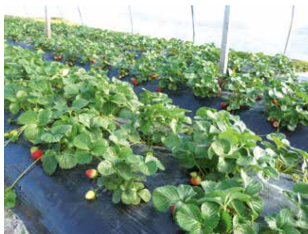
Figura 2 - Cultivo en macrotúneles del cv. INIA Ágata (SGN48.3) la principal variedad en la zona de Salto. La tolerancia al nuevo complejo de enfermedades entre otras virtudes favoreció su adopción masiva. Cosecha en otoño (22 de mayo 2017).

La crisis sanitaria se logró manejar principalmente a través del uso de variedades tolerantes. Desde 2017, la variedad principal es INIA Ágata (Figura 2), tolerante a enfermedades de tallo y raíz, a oídio, precoz, productiva y de buen tamaño de fruta (Hoja de divulgación N° 108: El Cultivar para cultivo protegido INIA Ágata (SGN48.3), octubre 2017).