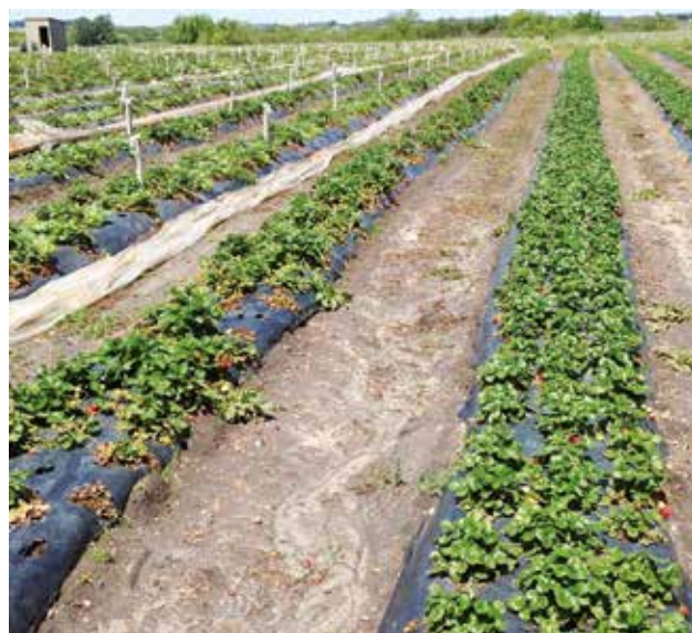
Figura 3 - Dos variedades de diferente reacción a las enfermedades, a la izquierda (Strawberry Festival), sensible, con importante mortandad de plantas y a la derecha INIA Ágata tolerante.

Se discontinuaron las variedades INIA Yuri, INIA Guapa y Strawberry Festival (Figura 3). Fueron implementadas varias tecnologías a nivel predial que no se adoptaron significativamente, entre ellas: la utilización de plantas madres micropropagadas de variedades sensibles al complejo de hongos, las plantas frigo y frescas importadas, el control químico, las plantas producidas en viveros sin suelo, los clones antiguos tolerantes (N25.1) y variedades extranjeras tolerantes con planta producida en viveros locales.