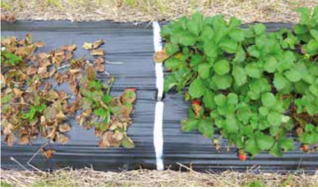
Figura 6 - Clon susceptible a la izquierda y clon tolerante a la derecha bajo las mismas condiciones ambientales y presión de enfermedades, INIA Salto Grande.