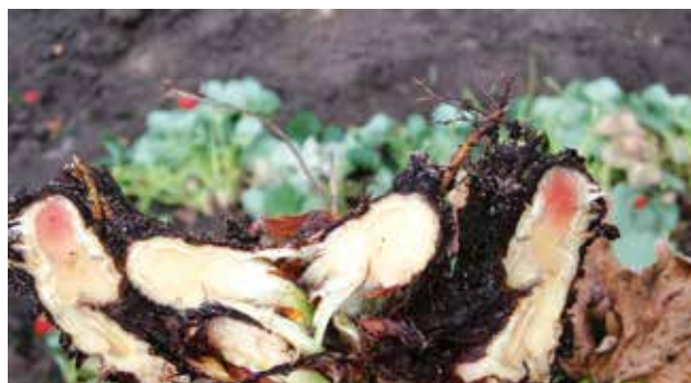
Figura 5 - Clon tolerante N25.1 con síntomas de daño en el tallo o corona al final del ciclo productivo. Las variedades con tolerancia alcanzan resultados productivos adecuados aún con presencia de enfermedades. Resulta frecuente aislar más de un hongo de cada planta analizada, por ej. en el caso de la foto se encontró Fusarium sp. y Rhizoctonia sp.

Las últimas variedades liberadas (INIA Guapa e INIA Ágata) demandaron nueve años desde el cruzamiento que las originó hasta su liberación comercial. La fase de validación se limitaba a uno o dos clones avanzados a nivel predial. Se entendió necesario acelerar el proceso, ampliando el número de clones evaluados en chacra, incrementando el número de observadores y sistematizando la información obtenida a partir del seguimiento del comportamiento en predios comerciales. En 2017 se identificó en INIA Salto Grande un grupo de siete clones con tolerancia a la mortandad de plantas bajo condiciones de infección natural. La tolerancia implica que la planta es capaz de cumplir con un ciclo productivo adecuado aún con la presencia de los patógenos (Figura 5).