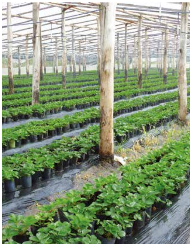
Figura 9 - Plantel de plantas madres bajo invernáculo. La producción de plantas madres en el propio predio gradualmente va siendo sustituida por el uso de plantas madres micropropagadas.